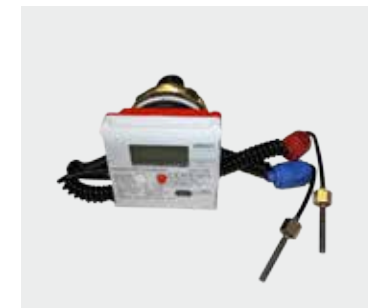
Wärmehähler MK Ultramaxx