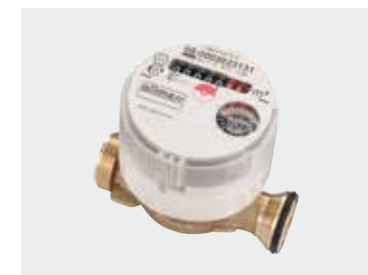
Austauschwasserzähler UP 3003