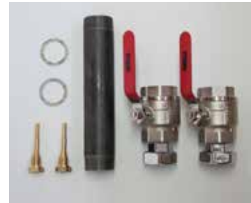
Einbausatz für Wärmezähler