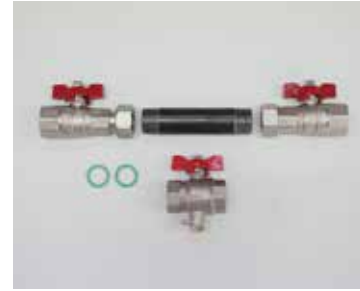
Einbausatz für Wärmezähler klein