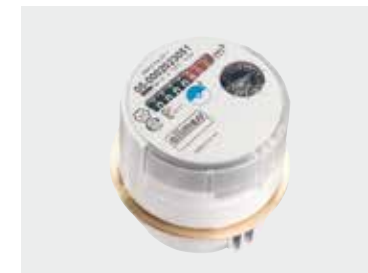
Austauschwasserzähler UP 6000