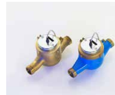
Hauswasserzähler mit Reedkontakt