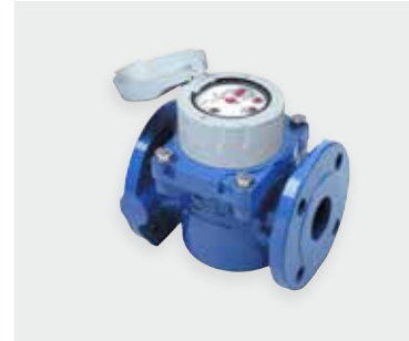
HELIX WP H 4000