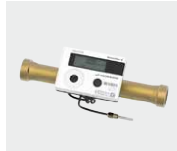
Kompakt Ultraschall Wärmezähler