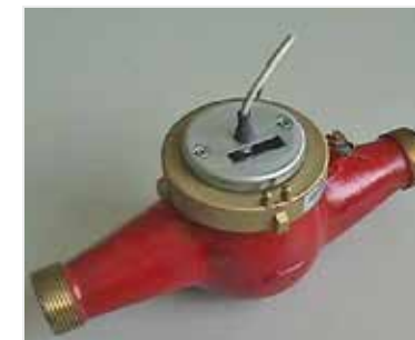
Hauswasserzähler mit Reedkontakt