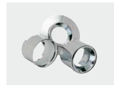
Zubehör für UP 6000