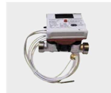
Wärmehähler Integral V UltraLite